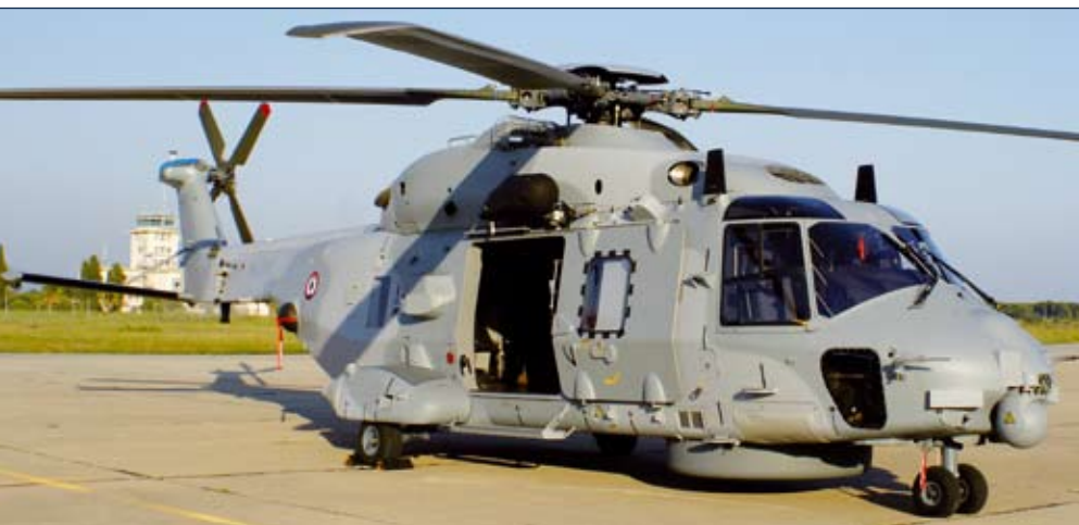
W bazie specjalnej jednostki testowej lotnictwa morskiego Cepsa 10/S w Hyères zaprezentowano pierwszy odebrany przez DGA śmigłowiec wielozadaniowy NH90 Caïman. Maszynę dostarczono 5 maja br., 7 września dotarła kolejna. Do tej pory obie wylatały ponad 80 h.

SUBTICS jest już w użyciu na Scorpènach oraz pakistańskich Agostach 70B. Został też kupiony przez kilka krajów Ameryki Płd. i Azji, w ramach modernizacji starych jednostek, w tym niemieckich 209 i szwedzkich A17. Posłużył też za punkt wyjścia do opracowania nowego systemu SYCOB dla francuskich okrętów z rakietami balistycznymi typu Le Triomphant (otrzymają go w ramach modernizacji, najnowszy z typu – Le Terrible ma go od początku). Daje to pojęcie o jakości i możliwości SUBTICS-a. Sporo do pokazania miał też Sagem. Jego maszt optroniczny serii 30 łączy w sobie kilka urządzeń (zależnie od klienta) i stanowi zasadniczy, nieakustyczny sensor zanurzonego okrętu. Ciekawy jest też radar serii 10 – pozornie zwykłe urządzenie nawigacyjne (i właśnie takie ma być!). Charakterystyka jego sygnału jest typowa dla wielu cywilnych urządzeń tej klasy, stąd trudno po przechwyceniu emisji radaru w rejonach przybrzeżnych, gdzie ruch