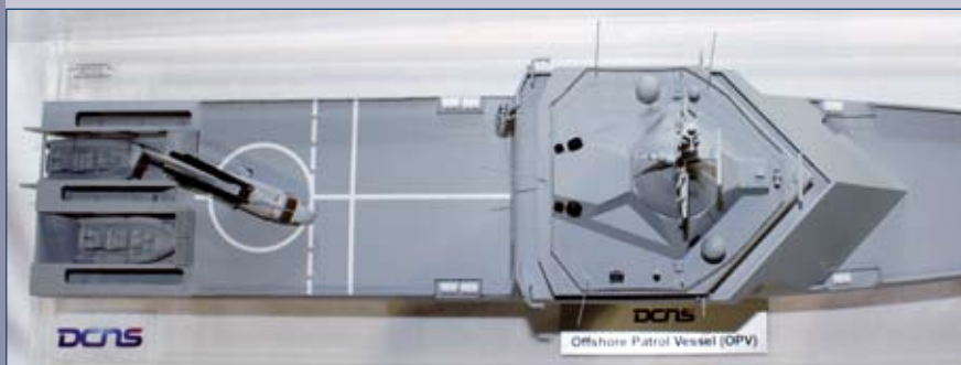
↑ Widok z góry części modelu Hermesa ( Gowinda OPV). Pokazuje on dok z rampami do wodowania łodzi oraz nadbudówkę zapewniającą obserwację okrężną i zintegrowany maszt.

7 maja br. DCNS w Lorient rozpoczął budowę – ze środków własnych – prototypowego OPV typu Gowind (patrz NTW 00/0000). Program Hermes jest efektem „dziury” w ofercie eksportowej koncernu w tym niezwykle ważnym segmencie. DCNS nieco „zaspał” i musi teraz nadrobić zaległości, co wcale nie będzie łatwe. Pomóc ma w tym właśnie przetestowanie okrętu w morzu (to na kupujących robi większe wrażenie, niż papierowe reklamówki) oraz zastosowanie w konstrukcji kilku usprawnień wyprzedzających konkurentów. Będą to m.in. rufowy dok do błyskawicznego wodowania dwóch łodzi inspekcyjnych, okrężnie oszklone główne stanowisko dowodzenia oraz system dowodzenia Polaris , który jest o wiele prostszy od systemów walki znanych z fregat, integruje bowiem małą liczbę sensorów (radar, głowice optroniczne i łącza Link 11) oraz uzbrojenie w postaci armaty kal. 76 mm. Ponadto jednostka otrzyma, po raz pierwszy we Francji, zintegrowany maszt, choć jak wynika z powyższego, nie będzie on szczególnie okazały. Wodowanie zaplanowano na drugą połowę 2011 roku. Okręt będzie testowany przez Marine nationale od końca tego roku, kiedy to ma być jej przekazany. Jako ciekawostkę możemy dodać, że w program jest zaangażowana też polska firma – Meblomor S. A., która dostarczy drzwi wodoszczelne.