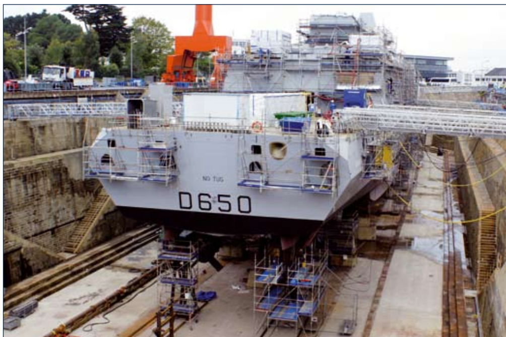
↑ Aquitaine w doku w Lorient.

Ekipa dziennikarska została przewieziona z Fort de Saint Elme, gdzie odbył się pokaz MWPS-a do bazy Marine nationale w pobliskim Tulonie, na pokładzie niezwykle ciekawego i awangardowego EDA-R (Engin de débarquement amphibie rapide, szybka barka desantowa). Jest to katamaran desantowy, znany wcześniej od jako L-Cat (Patrz NTW 1/2009), opracowany przez Constructions industrielles de la Méditerranée (CNIM). Ci, którzy mieli wątpliwości, że ta nietypowa konstrukcja ma szanse na produkcję seryjną, dziś z pewnością są zdziwieni. DGA złożyło już zamówienie na cztery barki w wersji seryjnej, różniącej się nieco sterówką, detalami konstrukcji, systemami łączności wojskowej i lekkim uzbrojeniem strzeleckim. Są one przeznaczone dla obu BPC – po dwa mieszczą się w dokach każdego