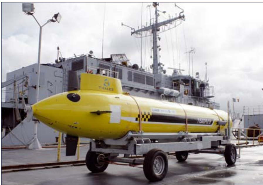
W pełni autonomiczny, bezałogowy pojazd podwodny Asemar na wózku transportowym.

W związku z programem FREMM, uczestniczące w nim firmy zaprezentowały systemy i urządzenia przeznaczone dla tych okrętów. Szczególnie okazałe wygląda system hydrolokacyjny opracowany przez Thalesa. Tworzy go antena kadłubowa w gruszcze dziobowej UMS 4110 oraz holowany zespół CAPTAS 4 (Combined Active and Passive Towed Array Sonar). Antena UMS 4110 zostanie niebawem zainstalowana na Aquitaine . Jest to to samo urządzenie, które wcześniej wybrano dla „Horyzontów”. Ten drugi system składa się z kilku podzespołów – „rybki” wykonanej z brązu, połączonej z obudową z kompozytu węglowego, mieszczącej cztery pierścienie kryjące aktywne przetworniki emitujące sygnał, osobnej instalacji z kabloliną sonaru pasywnego oraz instalacji do wodowania obu anten. Część aktywna wy-