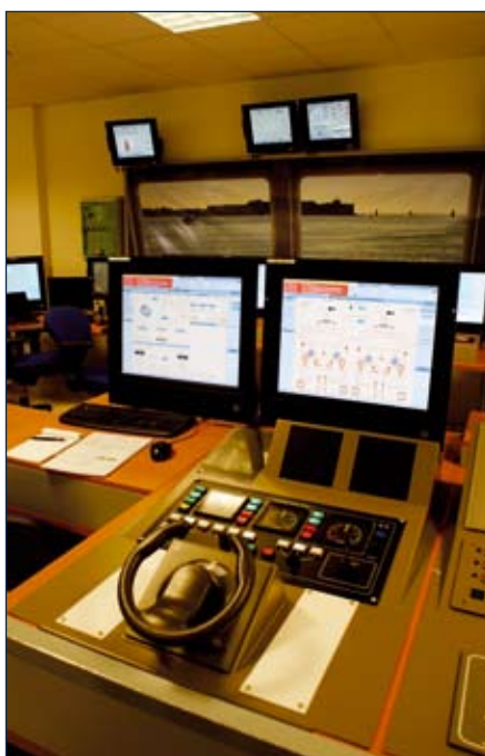
↑ DCNS w Lorient ma swój ośrodek integracji systemów mechanicznych i nawigacyjnych. Na zdjęciu makietka funkcjonalna fregaty typu FREMM ze stanowiskiem sternika. Jak widać, w szerokim zakresie używane są urządzenia zakupione na rynku cywilnym – COTS.

z nich. W czasie rejsu zaprezentowano działanie pokładu ładunkowo-pontonu, który w czasie podejścia do plaży i wylądunku znajduje się w dolnym położeniu zwiększając pływerność, zaś do tranzytu morzem z dużą prędkością unoszony jest do górnej pozycji, opierając się na dwóch belkach łączących oba kadłuby katamaranu. Operacja jest szybka, trwa około minuty. Jednostka równie dobrze sprawnie się na nieprzygotowanej plaży, jak i na przypadkowym nabrzeżu portu. W kwietniu br. po raz pierwszy przeprowadzono próby z załadunkiem na nią czolgu podstawowego Leclerc .