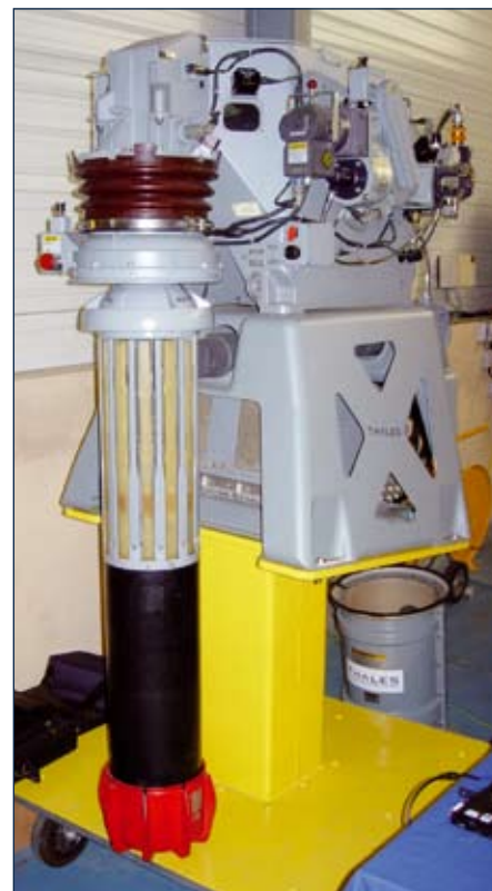
↑ Jednym z zasadniczych elementów systemu poszukiwania okrętów podwodnych Caïmanów będzie sonar zanurzalny Thales FLASH (Folding Light Acoustic System For Helicopters). Takie urządzenie są też oferowane naszej marynarce, która zapytała o możliwość ich instalacji na Sea Sprite 'ach. Odpowiedź otrzymała, jednak dalsza korespondencja nie była kontynuowana. Na bazie FLASH-a w ośrodku w Breście powstaje jego lekka wersja dla bezzałogowców nawodnych (dla Marine nationale i US Navy).

duży bezzałogowiec nawodny (USV) do transportu bezzałogowych pojazdów podwodnych (UUV) do poszukiwania, klasyfikacji i niszczenia min, który sam z kolei będzie przewożony przez okręt-matkę. Prace nad USV (zwanym przez twórców USV-taxi) ruszyły w lipcu 2009 roku w ramach projektu ESPANDON (Évaluation de solutions potentielles d'automatisation de déminage pour les opérations navales) finansowanego przez DGA. Ważną składową systemu będzie podsystem łączności pomiędzy okrętem-matką, USV-taxi i pojazdami podwodnymi oraz urządzenia do ich automatycznego wodowania. Dla sprawnego działania systemu bardzo ważną jest wiedza o bieżącym stanie środowiska podwodnego (dane batymetryczne, oceanograficzne itp.), która pozwoli na przygotowanie misji MCM. Do tej roli ECA zbudowała Daurade – duży, dobrze wyposażony autonomiczny UUV. Przenosi on sonar boczny, echosondę wielowiązkową, kamerę TV współpracującą z reflektorami. Analiza zebranych danych jest prowadzona częściowo na pokładzie Daurade , a częściowo – po przesłaniu łączem radiowym – na pokładzie okrętu bazowego. Pozwolą one na zaplanowanie misji zasadniczego komponentu USV-taxi. Przewiezie on w wyznaczone miejsce UUV do poszukiwania i klasyfikacji, a także niszczenia min, jak np. znany już ECA K-Ster , gdzie nastąpi ich wodowanie i rozpoczęcie właściwej części operacji. Konkurencyjny UUV Asemar , opracowany przez Thalesa i ECA, do pewnego stopnia jest w pełni autonomiczny ( Daurade porusza po zaprogramowa-